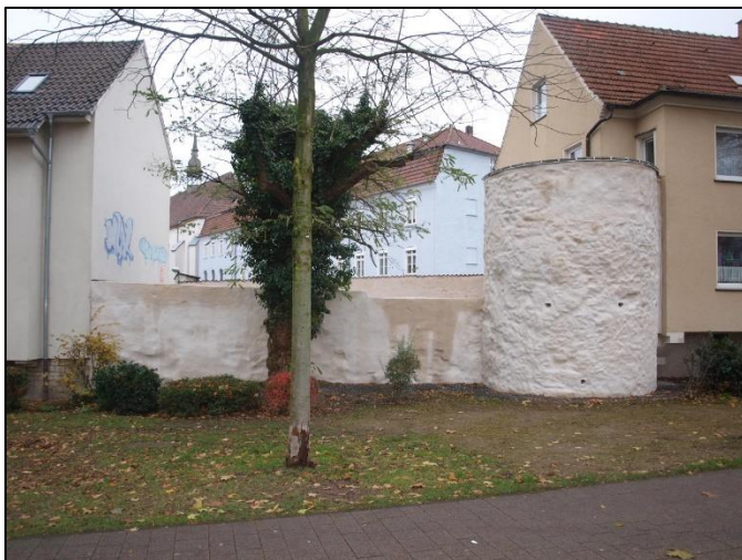
Aufnahme des Turmes mit einem Abschnitt der Stadtmauer Nach Abschluss der Restaurierungsarbeiten.

Zur Glashütte 12 33181 Bad Wünnenberg Telefon 02953/963440 Telefax 02953/963441 Handy 0171/6214858